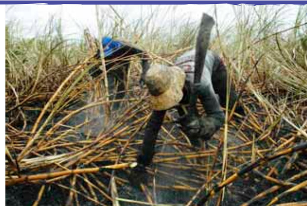
João Zinclar/Bahia, Brasil/2006

Esses migrantes que trabalham no corte da cana são frequentemente desumanizados, desqualificados, e submetidos a explorações de vários níveis, inclusive à escravidão. E, muitas vezes, nas cartas trocadas com a família, toda essa situação de dor e sofrimento é silenciada, por vergonha ou por quererem poupar as pessoas queridas de mais esse sofrimento.