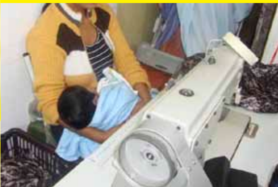
Bianca Pyl/São Paulo, Brasil/2012

No mesmo dia em que a grife de roupas femininas Gregory lançava a sua coleção Outono-Inverno 2012 com pompa e circunstância, uma equipe de fiscalização do Ministério do Trabalho flagrava situação de cerceamento de liberdade, servidão por dívida, jornada exaustiva, ambiente degradante de trabalho e indícios de tráfico de pessoas em uma oficina que produzia peças para a marca, na zona norte da cidade de São Paulo. O conjunto de inspeções resultou na libertação de 23 pessoas, todas elas estrangeiras de nacionalidade boliviana, que estavam sendo submetidas a condições análogas à escravidão.