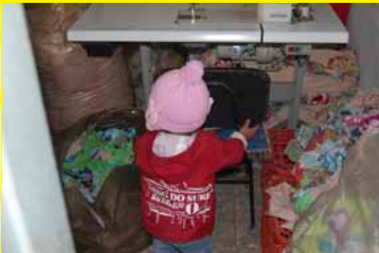
Bianca Pyl/São Paulo, Brasil/2012

Um grupo de oito pessoas vindas da Bolívia, incluindo um adolescente de 17 anos, foi resgatado de condições análogas à escravidão pela fiscalização dedicada ao combate desse tipo de crime em áreas urbanas, de acordo com o Ministério do Trabalho e Emprego. A libertação ocorreu no dia 19 de junho. Além dos indícios de tráfico de pessoas, as vítimas eram submetidas a jornadas exaustivas, à servidão por dívida, ao cerceamento de liberdade de ir e vir e a condições de trabalho degradantes. O grupo costurava para a marca coreana Talita Kume, cuja sede fica no bairro do Bom Retiro, na zona central da capital paulista.