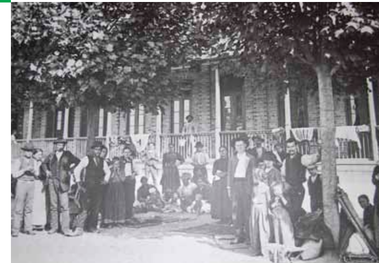
Memorial do Migrante/São Paulo, Brasil/1906

De 1850 até as primeiras décadas do século 20, começou um processo de forte incentivo à vinda de imigrantes, principalmente de europeus. Por trás disso, havia uma ideologia racista: além de muitos senhores se negarem a pagar salários aos negros, a partir da abolição, o objetivo era “branquear” a população local! Nesse período, estima-se que mais de quatro milhões de portugueses, italianos, espanhóis, alemães e japoneses chegaram ao Brasil para trabalhar na agricultura e na indústria, que lentamente começava a se desenvolver.