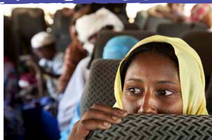
Albert Gonzalez Farran/Sudão/2011

São consideradas refugiadas as pessoas que saíram de seu país de origem por medo justificado de serem perseguidas por motivos de raça, religião, nacionalidade, opinião política ou participação em grupos sociais, e que, por isso, não possam (ou não queiram) voltar para casa, ou aquelas que foram obrigadas a deixar seu país devido a conflitos armados, violência generalizada e violação massiva dos direitos humanos. Segundo o Alto Comissariado das Nações Unidas para os Refugiados (ACNUR), em 2010, existiam 15,4 milhões de pessoas nessa situação no mundo todo. Em Darfur, no país africano do Sudão, estima-se que, desde 2003, um conflito étnico e por terras férteis matou mais de 300 mil pessoas e resultou em mais de 2,7 milhões de refugiados. Essas pessoas têm migrado para países vizinhos, como Chade, Uganda, Quênia e Egito, ou vão para campos de refugiados no próprio país, onde vivem em condições bastante precárias.