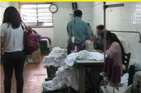
Bianca Pyl/São Paulo, Brasil/2011

Nem uma, nem duas. Por três vezes, equipes de fiscalização trabalhista flagraram trabalhadores estrangeiros submetidos a condições análogas à escravidão produzindo peças de roupa para a badalada marca internacional Zara, do grupo espanhol Inditex. Na operação de agosto, que vasculhou subcontratadas de uma das principais “fornecedoras” da rede, 15 pessoas, incluindo uma adolescente de apenas 14 anos, foram libertadas da escravidão contemporânea pelo Ministério do Trabalho e Emprego de duas oficinas – uma localizada no centro da capital paulista e outra na zona norte.